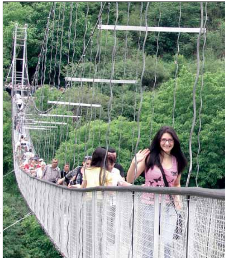
Լուսավորող՝ Չ. Գալստյանի ֆոտո:

Ըստ ժողովրդական ստուգաբանության՝ Խնճորեսկ անվան արմատը «խնճոր» բառն է: Շատերը, այդ թվում նաև արձակագիր Սուրեն Այվազյանը, համոզված են, որ Խնճորեսկ անունը բխում է խոր ծոր իմաստից, որը հետագայում հնչյունափոխվել է դարձել է Խորճորեսկ: